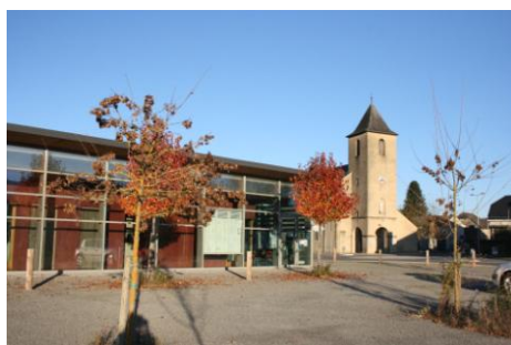
Mairie d'Escout 64870

Cotisation et revues (hors France) : 35$