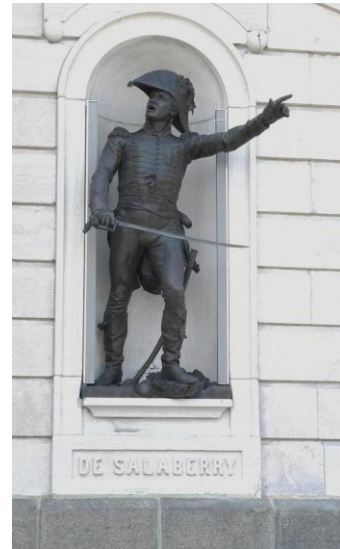
Devant le parlement de Québec

De Ciboure, on trouve d'autres personnes parties comme Salaberry :