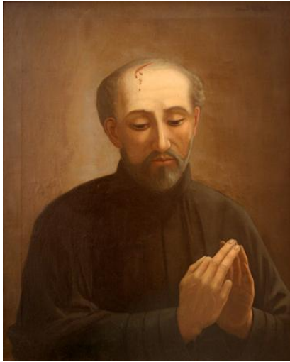
Isaac Jogues, peinture à l'huile de Donald Guthrie McNab.

Il est fait prisonnier par les Iroquois en 1642, alors en guerre contre la France. Il subit des tortures et est traité comme un esclave dans un village près d'Albany. Des marchands calvinistes hollandais l'aident à s'échapper.