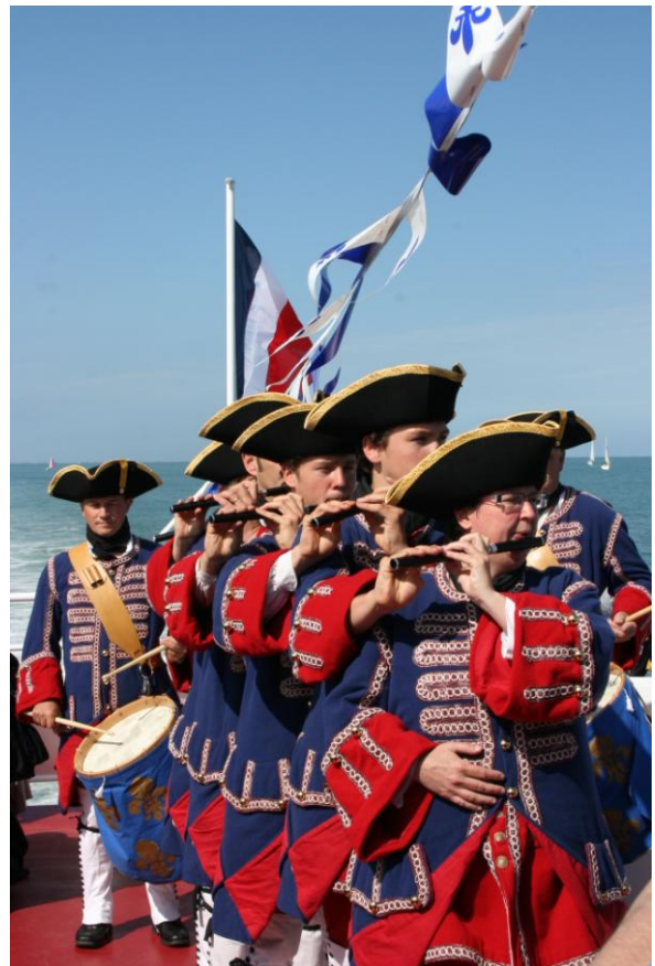
Le départ de La Rochelle des troupes du roi

Après son mariage avec la fille du chef , Jean-Vincent est désormais membre de la tribu des Pentagouets, Il devient un maillon essentiel dans les rapports des Français de Québec et de l'Acadie avec les peuples abénaquis.