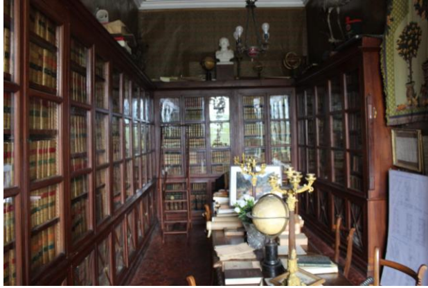
La magnifique bibliothèque et le donjon du 13 ème siècle

Un après midi historique : la visite du château de Coaraze, guidée par C. de Dufau. Nous avons déjà évoqué ce château (lettre n°111)