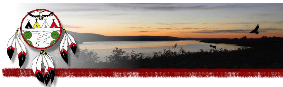
Ci-dessus, extrait du site « Première Nation Malécite du Madawaska »

A plus grande échelle, cette confédération était une renaissance de l'ancienne idée Mawooshen. Encore aujourd'hui, ces populations de la Nouvelle Angleterre du Nord et des provinces atlantiques sont connues et identifiées dans leur ensemble comme étant les Wabanakis.