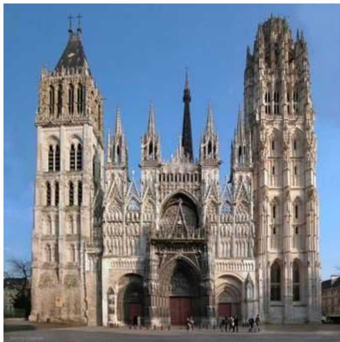
Cathédrale de Rouen

Samedi, à cinq heures du matin, on leur a fait visiter l'église cathédrale dont la vaste dimension a paru les étonner. Ils sont montés dans la tour où sont placées les cloches qui ont fixé leur attention d'une manière toute particulière. Un incident est venu là montrer la supériorité de résolution que les femmes possèdent dans le caractère. On a voulu les faire passer par dessus le pont de planches qui conduit aux galeries extérieures, d'où l'on jouit d'un magnifique panorama de la ville : les hommes n'ont jamais pu se résoudre à la franchir, à l'exception d'Esprit Noir que l'exemple des deux femmes a fini par entraîner. »