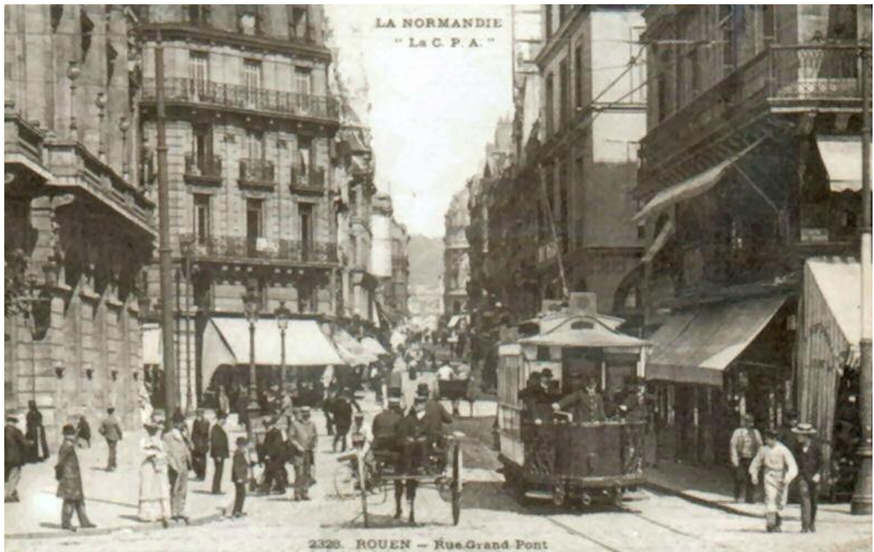
Rouen – rue Grand Pont (au début du 20ème siècle)

Rentrés à leur hôtel, ils se sont mis au balcon et ont renouvelé leurs adieux à la foule innombrable qui se pressait dans toute la rue Grand-Pont et qui luttait des mains à leur vue. Enfin, à dix heures, ils se sont rendus en voiture à la barrière Saint-Paul, où ils sont montés dans le Vélocifère*, qui les a emportés pour la capitale ».