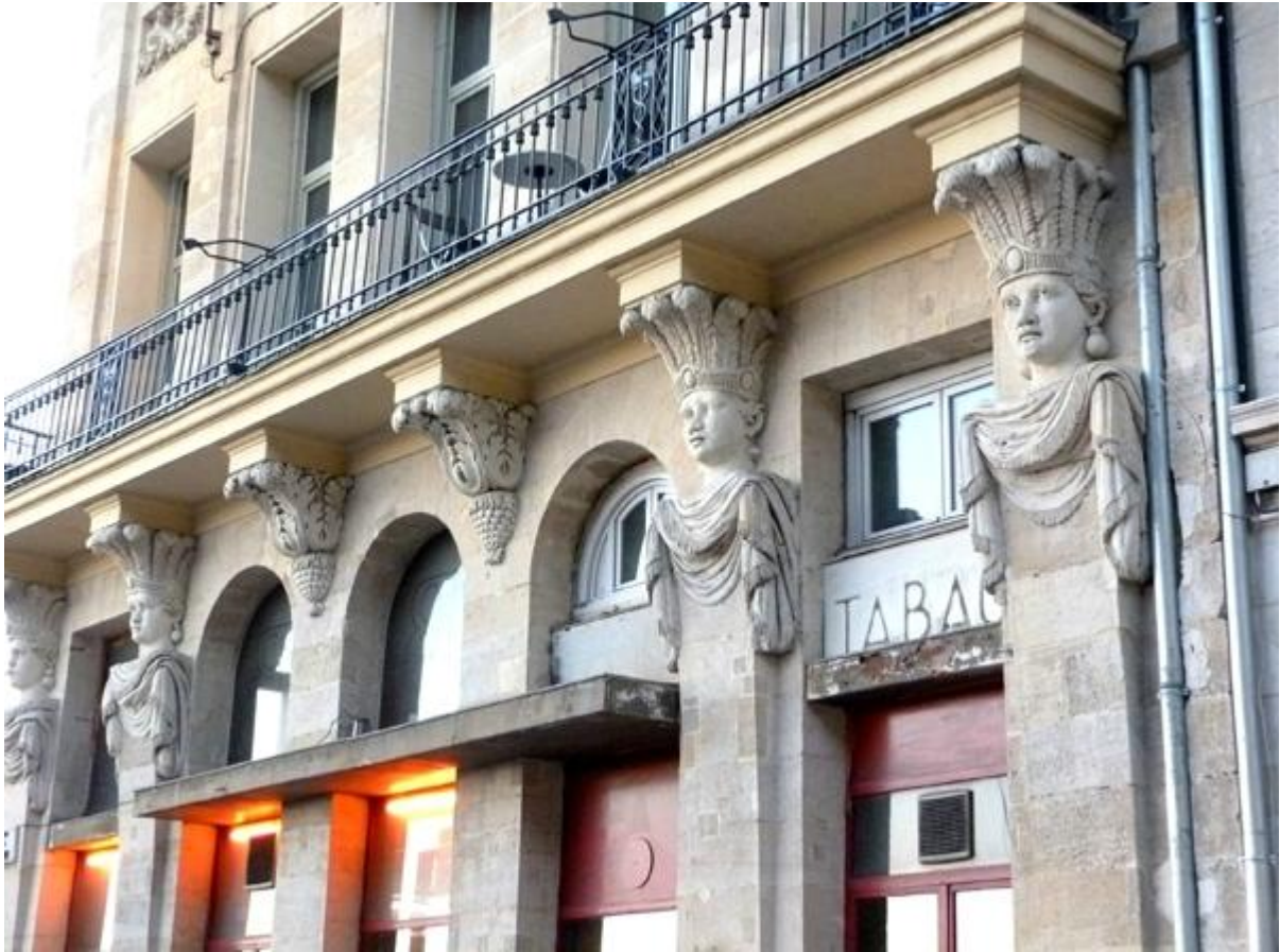
L'hôtel des Sauvages