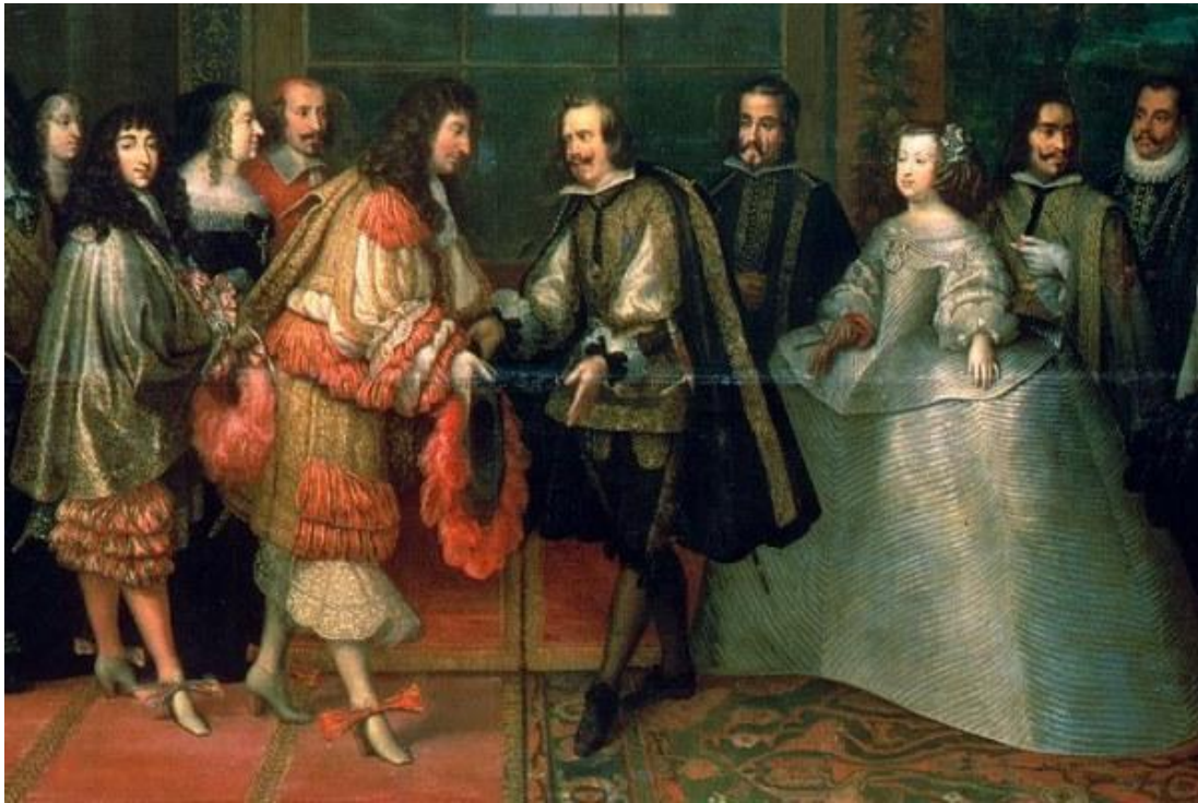
( https://www.herodote.net , (Herodote, le média de l'Histoire))

7 novembre 1677 : A cette époque, la côte acadienne est complètement ravagée,, l'intérieur du pays étant demeuré inculte et peu habité. Le baron de St Castin vit parmi les abénaquis. Le commandement de l'Acadie est passé entre les mains de Pierre de Joibert écuyer du roi.