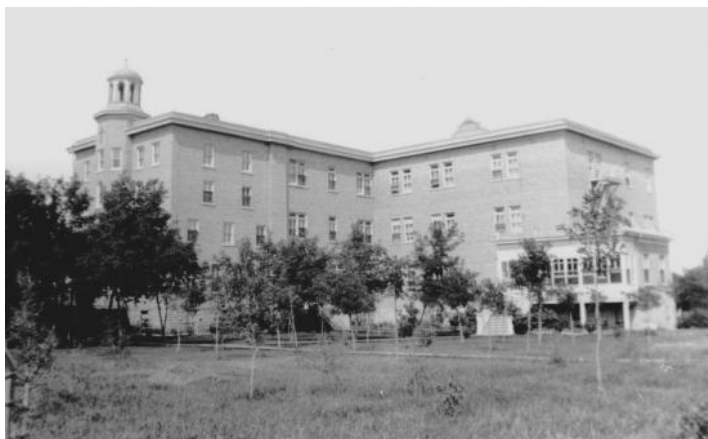
Couvent des Filles de la Croix à Saint-Adolphe en 1934.