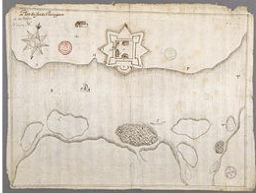
Fort de Pentagouët en 1670

Le petit groupe embarqua à bord d'un sloop jusqu'à Pemaquid. Là, ils embarquèrent dans une innocente barque de pêche. « Ils firent voile jusqu'à la rade de Penobscot et s'arrêtèrent le long d'une île proche de Pentagouet » le 24 octobre 1692.